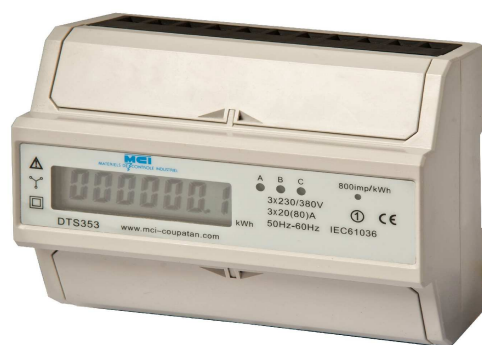
Affichage LCD Ref MCI : 031042

Tension de référence : 3x230/380V 50/60 Hz Intensité de démarrage : 80mA Intensité nominale : 20A Intensité max : 80 A Classe de précision : 1 Conforme à la norme IEC 61036 Sortie d'impulsion SO bornes 9(+) et 8(-) : 800 Imp/Kwh, de 18 à 27 Vcc, max: 27 mA Durée de l'impulsion : > 30 ms Affichage : 7 chiffres dont une décimale Consommation < 2 W Température de fonctionnement : -10°C à +45°C Humidité de l'air moyenne max.: 75%