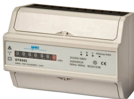
Affichage mécanique Ref MCI : 031044